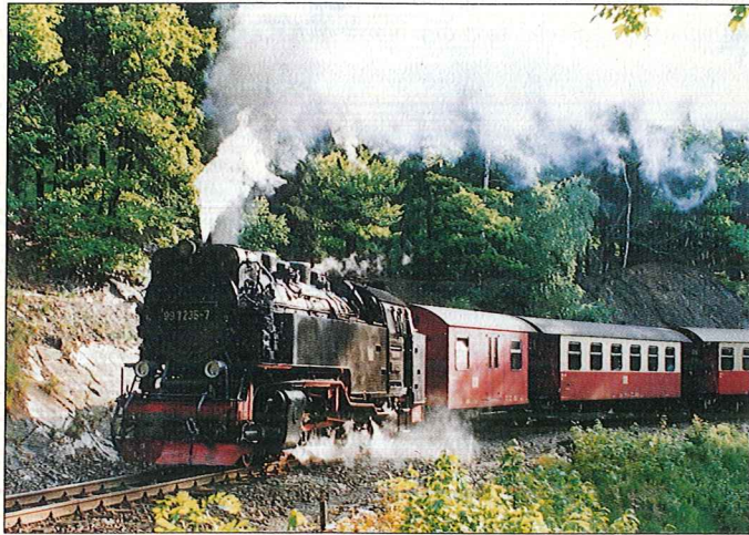
Seit über 100 Jahren fährt die romantische Selketalbahn durch Alexisbad.

Wissen vermitteln, in Zurückgezogenheit Wissen aufzubereiten und zu festigen und in den Hintergrund getretenes Wissen aufzufrischen, das ist der Sinn von Seminaren. Wir bieten dafür beste Voraussetzungen und moderne Technik. Unsere Tagungskapazitäten umfassen Räumlichkeiten vom Meeting für drei