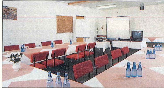
Tagungsräume in allen Größenordnungen.

Deshalb: Herzlich willkommen im Hotel HARZQUELL!