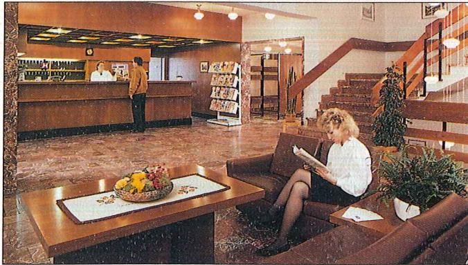
Die Wärme unseres Hauses spürt man gleich im Empfang.

Deshalb: Herzlich willkommen in Alexisbad!