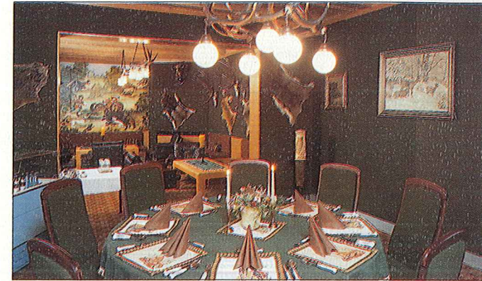
Für einen besonderen Abend: das Jagdzimmer.

Geblichen ist ein modernes Haus, dessen Team den Mut zu einem Neubeginn hatte. Nach Einführung der Marktwirtschaft und dem Wegfall jeglicher Subventionen hatte sich das Stammpersonal des früheren staatlichen Erholungsheimes das Ziel gesetzt, dieses schöne und attraktive Hotel zu erhalten. Das Stammkapital wurde von jedem einzeln aufgebracht, eine Gesellschaft gegründet und der Name HARZQUELL geboren.