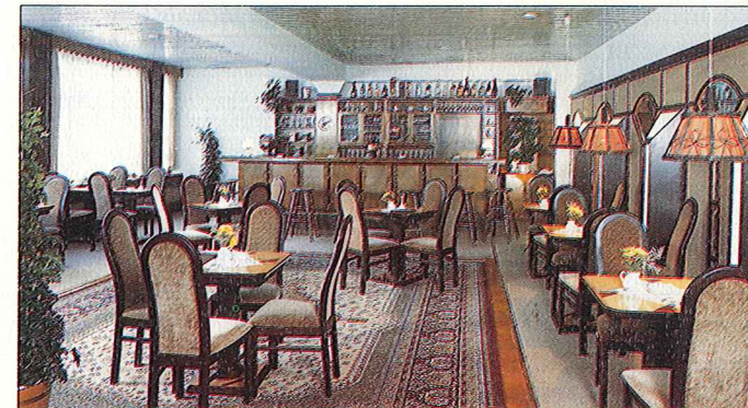
Die Bierbar für gemütliche Stunden.

Auch hier sind wir ehrlich. Am HARZQUELL entspringt keine Quelle, die Springbrunnen auf unserem großzügigen Vorgelände bilden dafür einen guten Ersatz. Bei der Namensgebung spielte die Quelle als Hoffnungsträger die größte Rolle. SEMINARHOTEL HARZQUELL ist daraus entstanden, die "Quelle des Wissens".